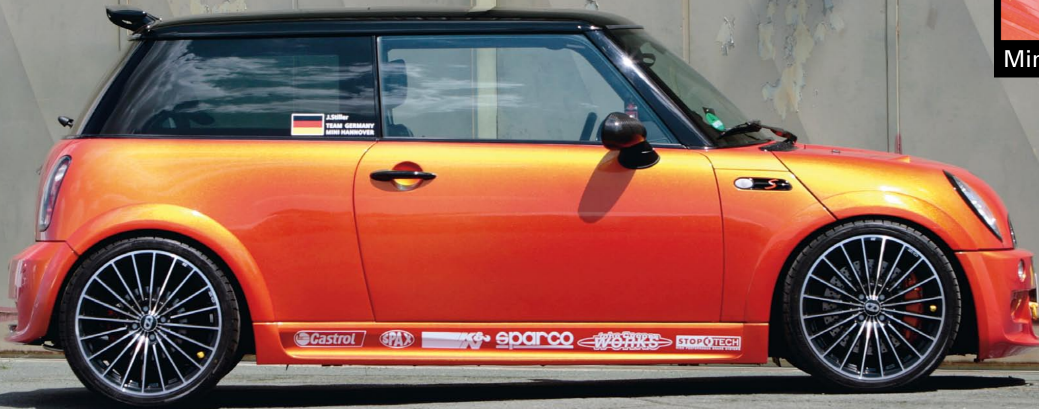
Cooler Lack kombiniert mit Rennsport-Optik