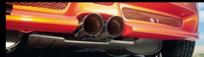
Der Auspuff umfasst JCW-Anlage, Stahlkat und Fächerkrümmer