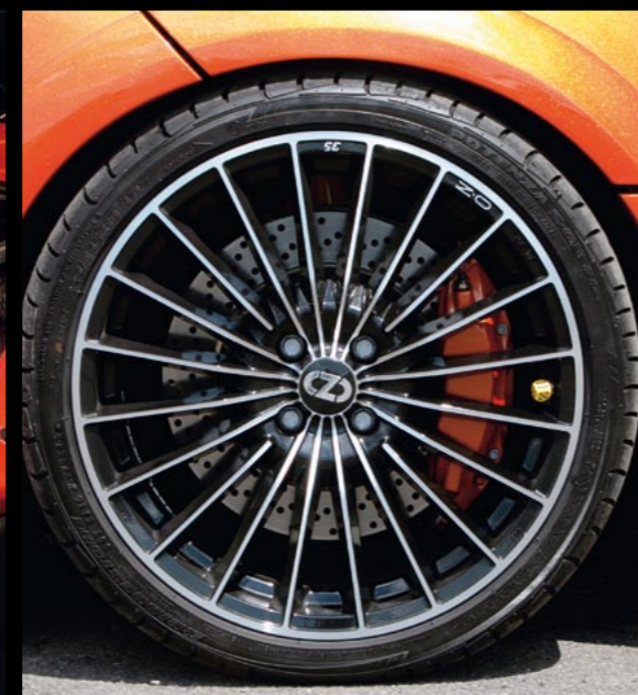
Hinter den O.Z.-Rädern sitzen üppige Bremsen