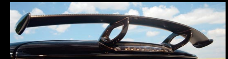
Aero-Paket mit Dachflügel