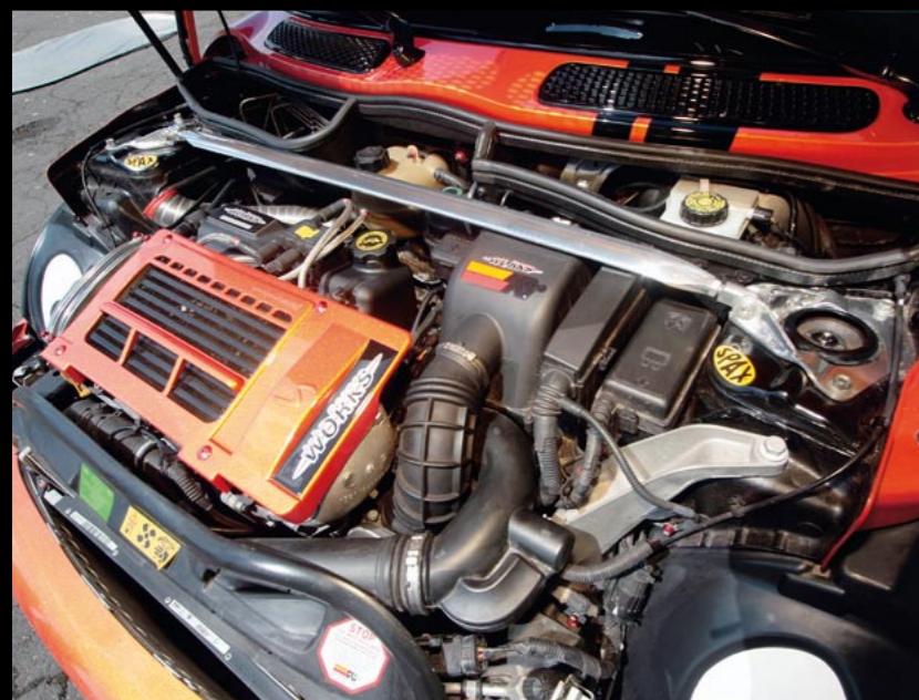
Stärker als zuvor - der Motor wurde überarbeitet